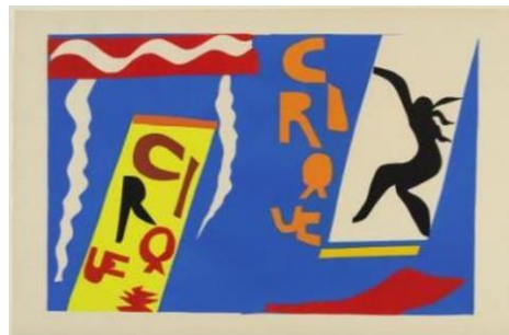
Henri Matisse Le cirque