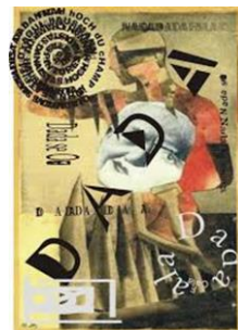
Raoul Hausmann Autoportrait